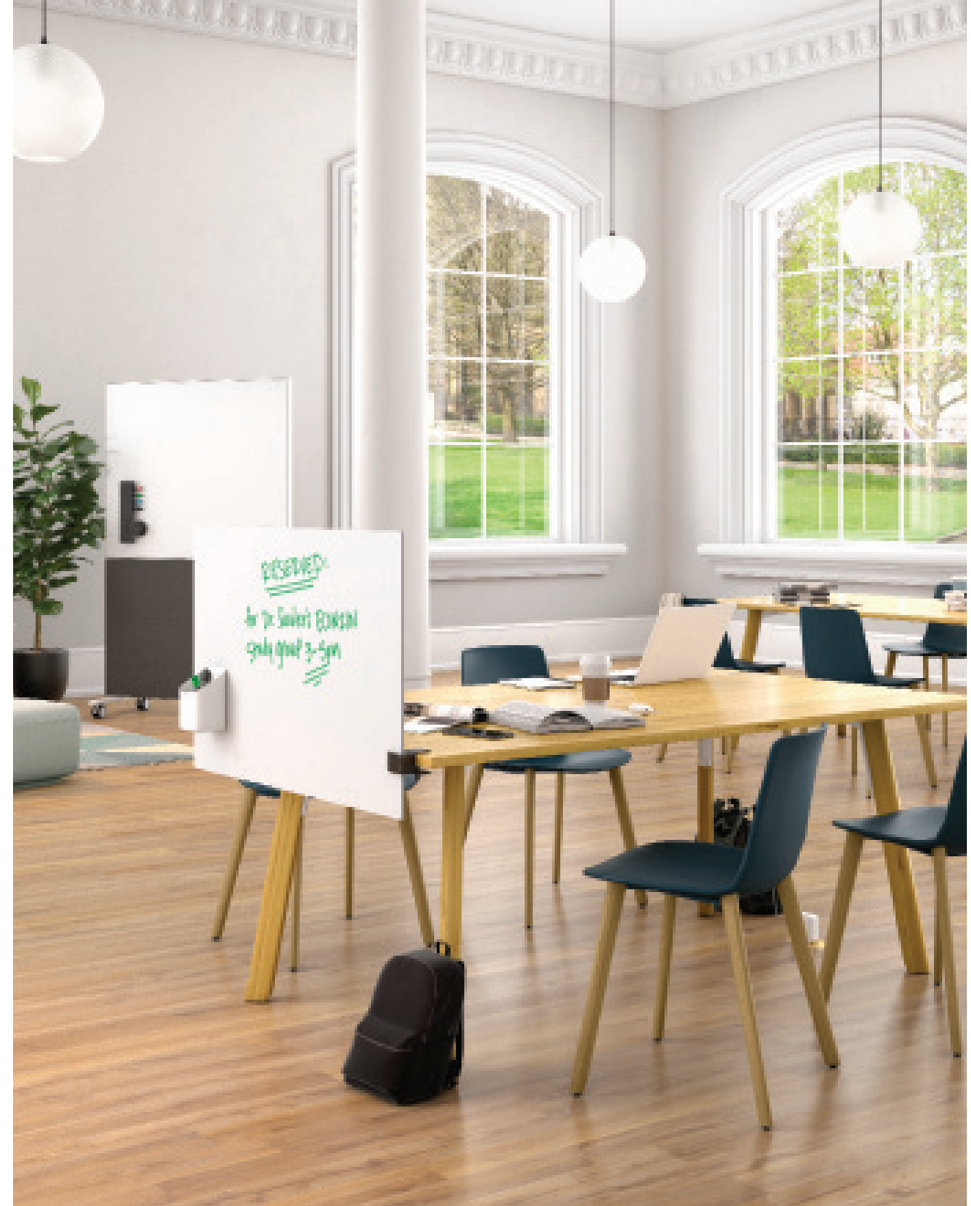
Arctic White Gloss im Privacy / Modesty-Aufbau

Mit einer Vielzahl von Größen, Farben, Konfigurationen und Montagemöglichkeiten passt Boundri überall hin, egal ob es sich um ein Großraumbüro, eine Krankenschwesterstation oder eine Bibliothek handelt.