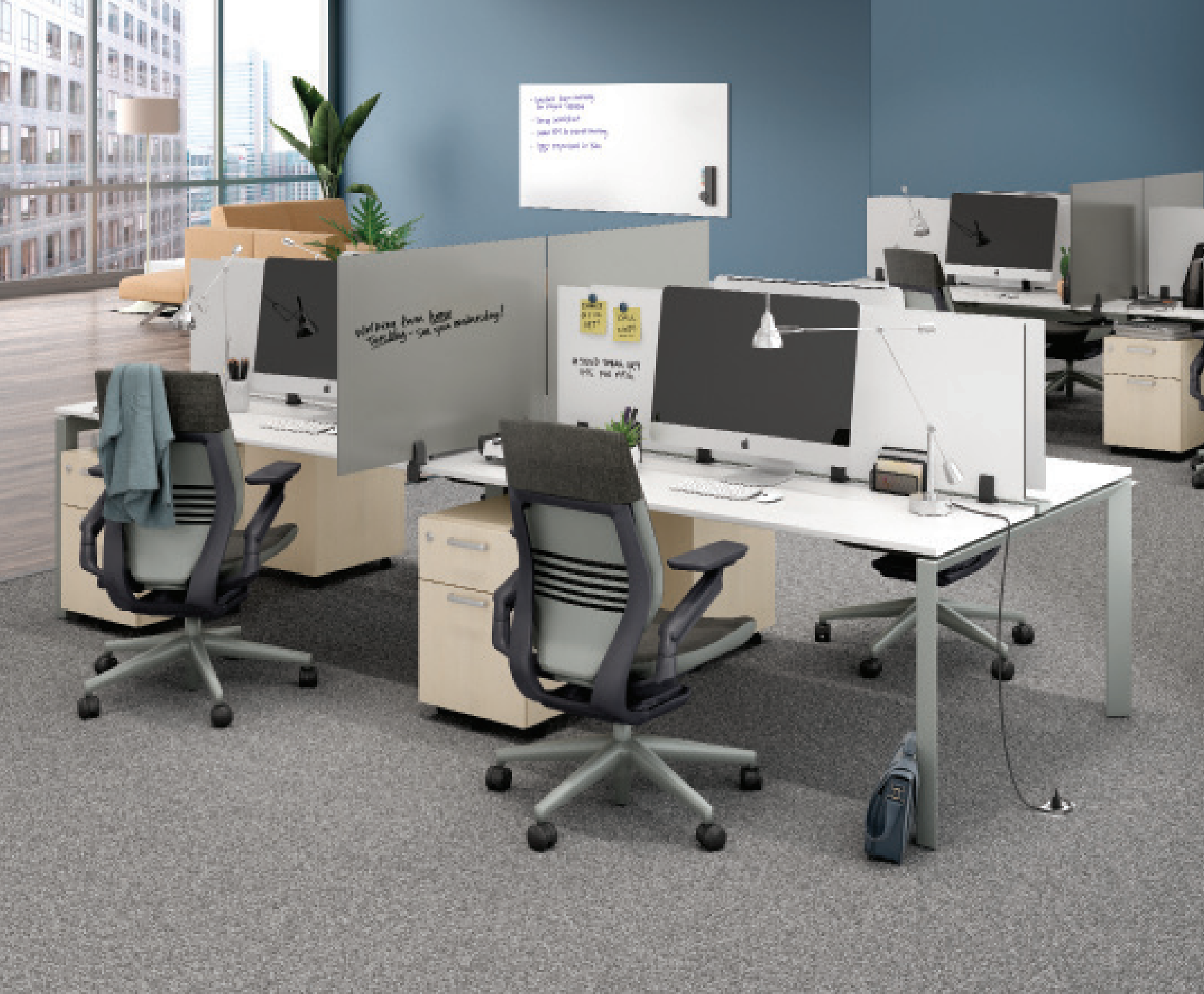
Side Divider in Platinum Solid Gloss / Top Mount-Aufbau und Arctic White Gloss für den Privacy / Top Mount-Aufbau

Verwandeln Sie jeden Bereich in einen sichereren, privateren Arbeitsbereich.